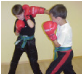
Kopfseitendeckung geg. Hacken, Backfist und Orfeige